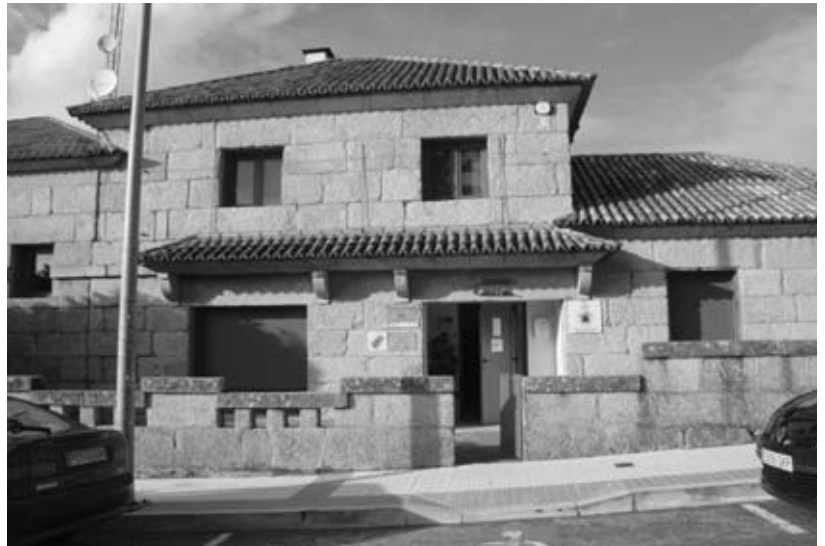
"Centro Antena" de Nigrán será o lugar onde se realizarán os obradoiros.

Además a finais de xaneiro, segundo informa apropiada concelleira,