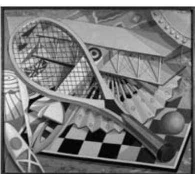
Elementos para o deporte, 1927.

A viaxe ao universo creativo de Maruja Mallo hase completar nos vindeiros meses coa publicación dun catálogo referencial e a edición dunha película documental producidos pola Sociedade Estatal de Conmemoracións Culturais, baixo a coordinación do Ministerio de Cultura. Ademais, a Fundación Caixa Galicia editará en 2010 a obra Maruja Mallo: de prometedora pioneira a artista universal. Materiais para unha biografía exacta e completa da pintora viveiresa entre 1902-1936 , traballo de Emilio Insua e Carlos Cal.