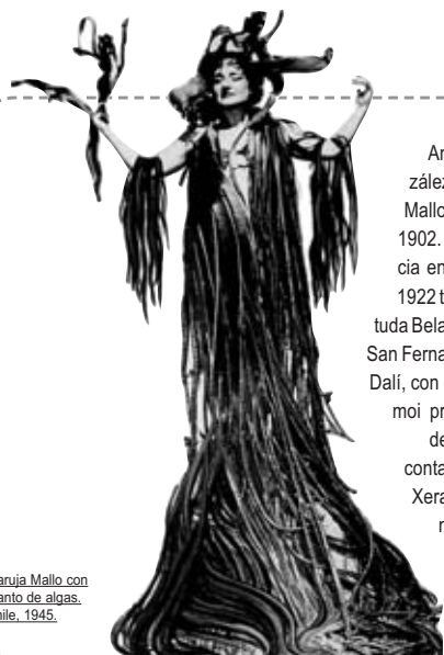
Maruja Mallo con manto de algas, Chile, 1945.