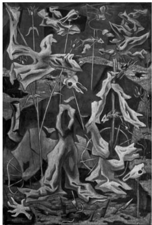
O espantapáexes, 1931.