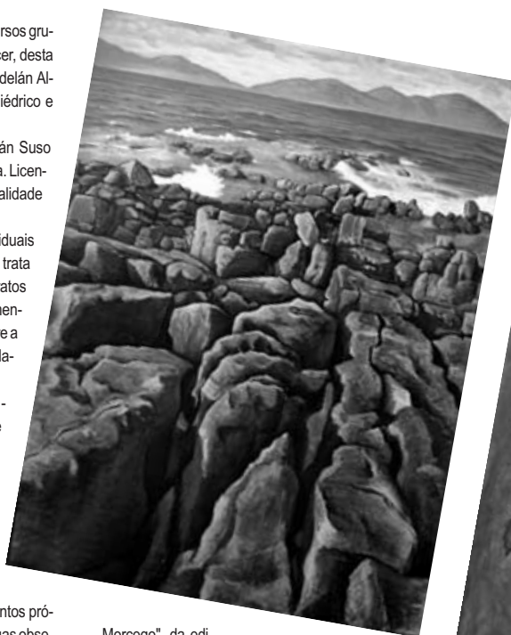
"Morcego", da editorial Galaxia e que se publica este mesmo ano.

No tocante á súa labouira coma ilustrador, ten publicados dous libros: "a lenda da Coca de Redondela", de Xesús Cameselle Ben e o conto infantil "Marcelo o